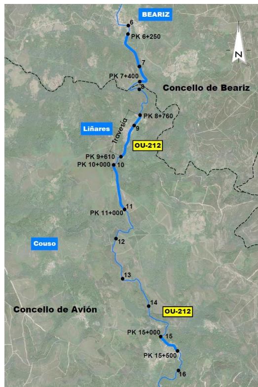
Treitos da actuación da 1ª fase