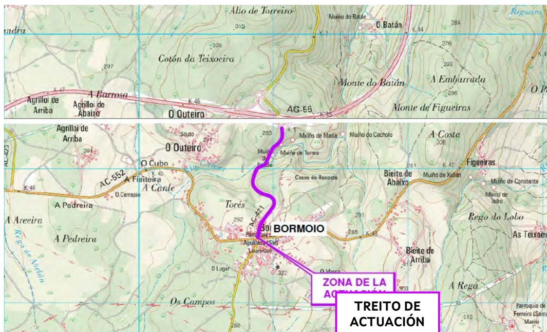
Treito de actuación

A previsión da Consellería de Vivenda e Planificación de Infraestruturas é poder aprobar o proxecto no primeiro trimestre de 2025, para a continuación realizar a convocatoria de levantamento de actas previas das expropiacións e licitar a execución das obras ao longo do vindeiro ano. O prazo de execución das obras é de 6 meses.