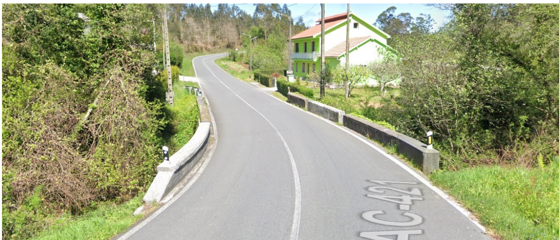
Paso sobre o río Calvar