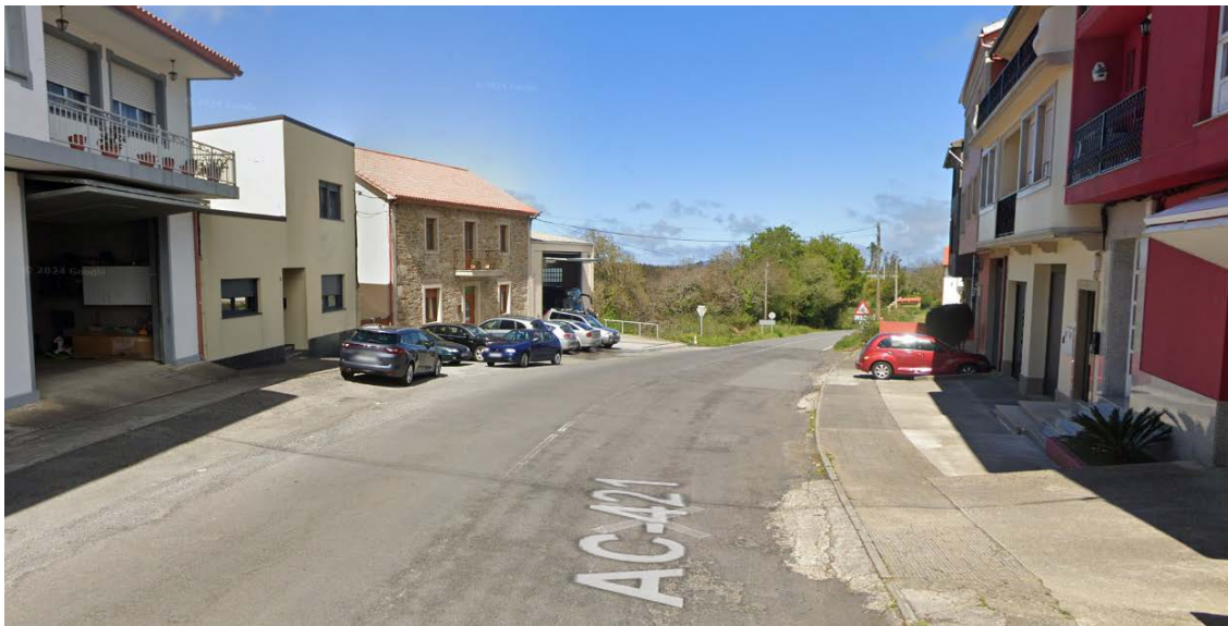
Travesía da AC-421 na Agualada