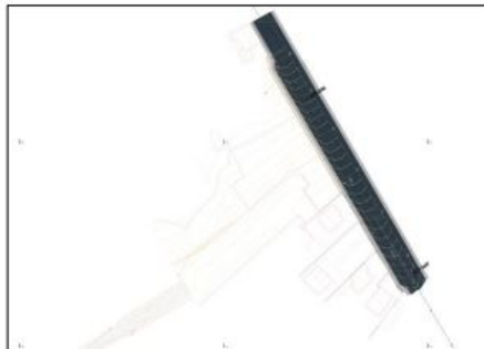
Estado actual do entronque na PO-531. Grafiado no plano se pode ver o final da pista de concentración parcelaria, en zahorra sen conectar coa glorieta