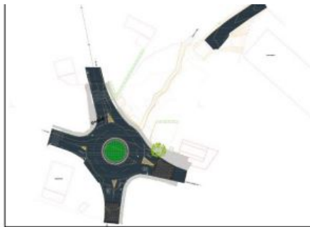
Estado actual do entronque na glorieta da intersección da PO-301 coa PO-300. Grafiado no plano se pode ver o final da pista de concentración parcelaria, aglomerado sen conectar coa glorieta