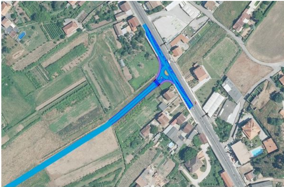
Planta xeral da intersección coa PO-531