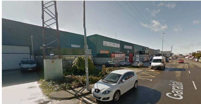
Proposta de intervención