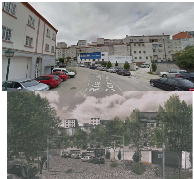
Proposta de intervención

O estudo analiza a problemática da intersección existente entre a avenida de Lugo, Os Concheiros e Rodríguez de Viguri, na cal a regulación semafórica con que conta para regular o intenso tráfico existente dificulta o cruzamento dos peóns.