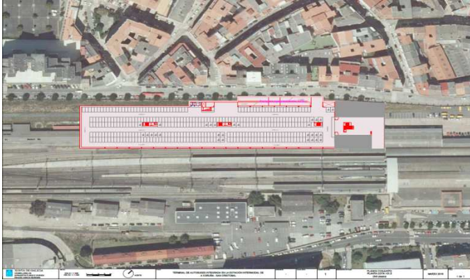
Planta do aparcadoiro