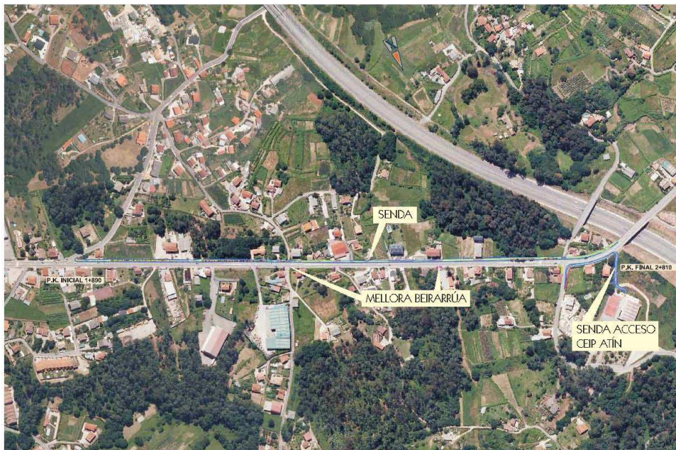
Plano de planta

A obra complétase coa colocación dunha rede de saneamento e doutra para pluviais en todo o tramo obxecto da actuación, e tamén co alumeadado da senda prevista na marxe dereita da estrada ata o CEIP de Atín.