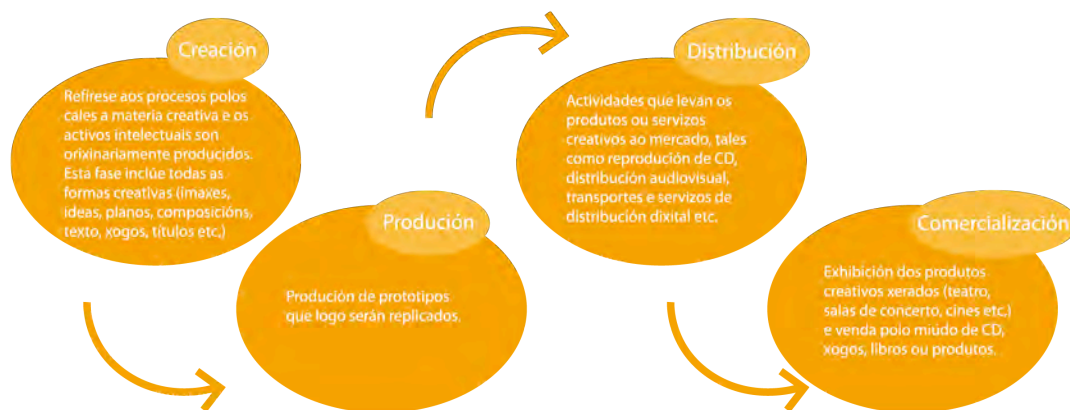
Gráfico explicativo da cadea de valor das industrias culturais e creativas.

Por último, a misión da Cidade da Cultura de Galicia ten que recoller a conectividade da cultura galega e das súas industrias culturais co exterior , de xeito que, por unha banda, sexa instrumento de proxección do noso potencial cultural e creativo, e, por outra, sirva de canle de observación e introdución de novas tendencias internacionais.