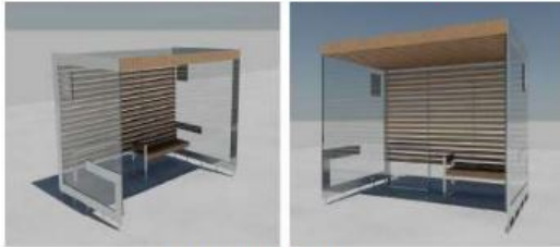
Marquesina modelo urbano