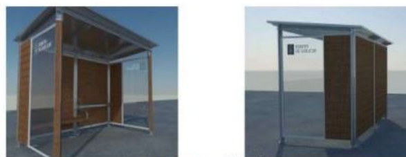
Marquesina modelo rural