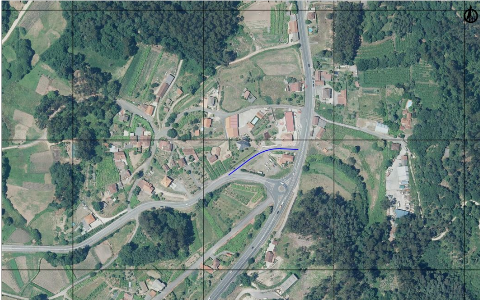
Treito antigo da EP-9407 A Goulla-Porráns: