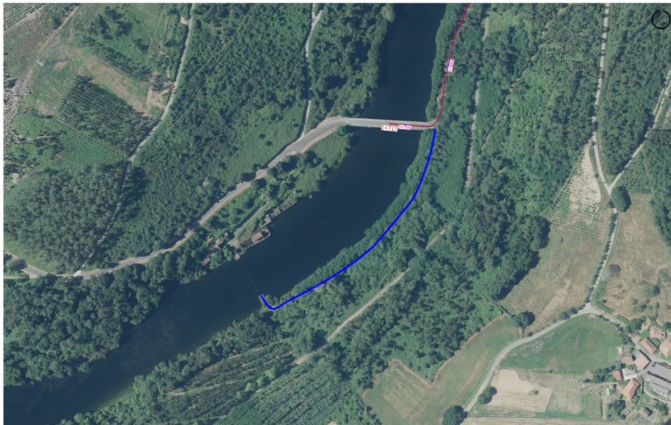
TREITO PROPOSTA DE TRANSFERENCIA

Trazado do treito antigo da EP-6402 Portodemouros-Ponte de San Xusto: